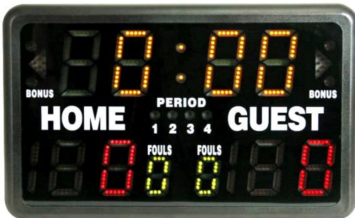
TABLEAU D'AFFICHAGE/CHRONOMÈTRE SPORT