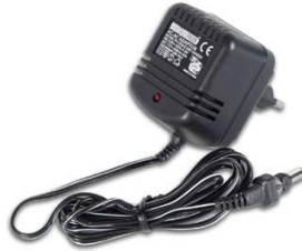
Bloc secteur 230VAC, consommation 15 watts